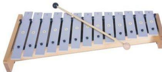
MÉTALLOPHONE OU GLOCKENSPIEL

Maîtres de leur univers aquatique, les poissons glissent lentement sur les arpèges au piano.